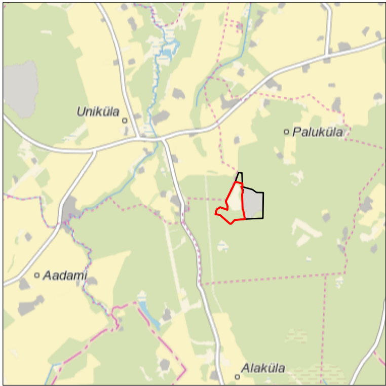
Kaardileht nr 5441 Tartu